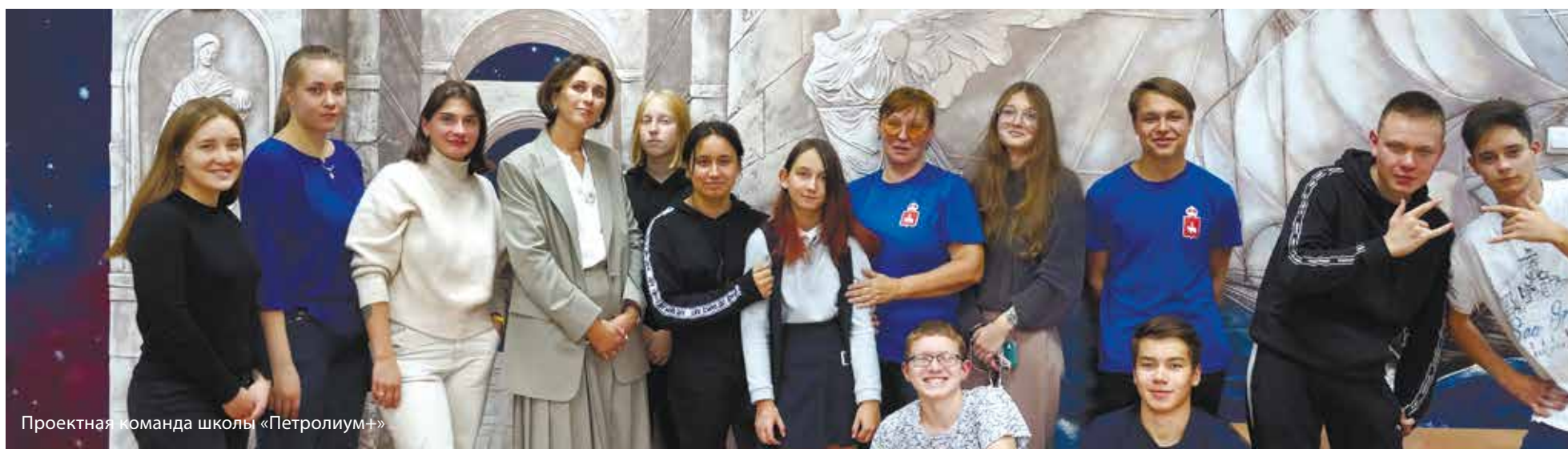
Проектная команда школы «Петролеум+»