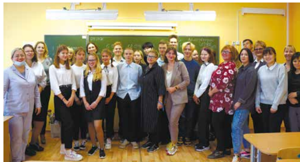
Проектная команда Юговской школы

— Я считаю, что акселератор будет полезен для воспитанников интерната. Да, им нужно немного больше времени на обдумывание идей, чем здоровым детям. Для них нужно адаптировать информацию. Педагогам интерната придётся много работать! Но по факту ребята имеют низкую социальную активность, ведь всё всегда делали для них, а теперь они должны постараться сделать что-то для других. Плюс ещё в том, что дети в интернате со всего Пермского края, и каждый может рассказать о красотах своей территории. Это отличная возможность расширить кругозор воспитанников. Уверена, что дети при помощи педагогов способны выдать неплохие идеи.