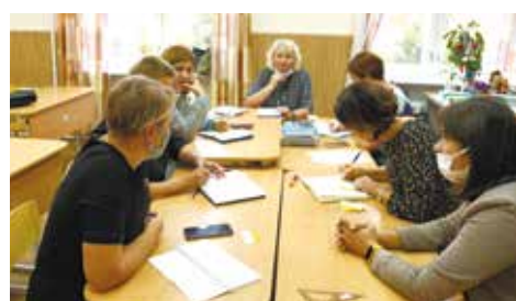
Проектная команда школы ЗТО Звёздный