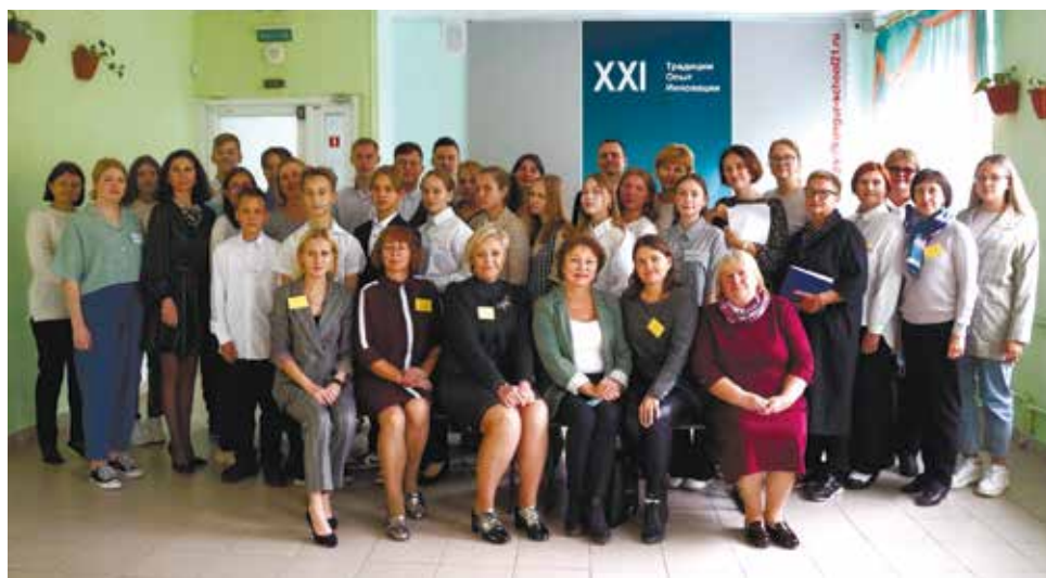
Проектная команда школы № 21 г. Кунгура