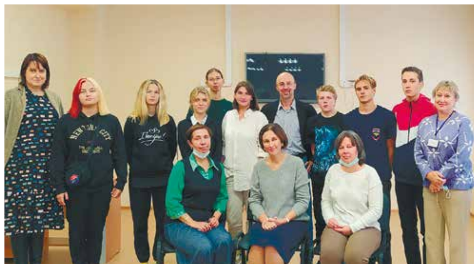
Проектная команда школы-интерната Пермского края