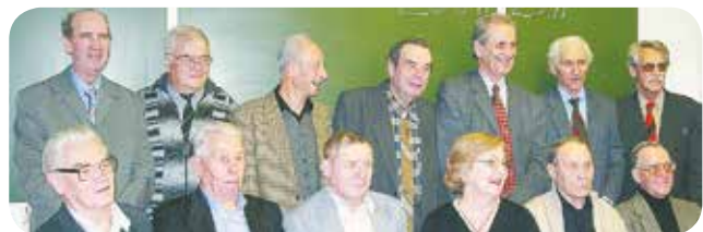
Выпускники 1954 года в ноябре 2007-го на встрече с директором школы

С чего для каждого из нас начинается история родного края? С истории своей семьи, микрорайона и, конечно же, школы.