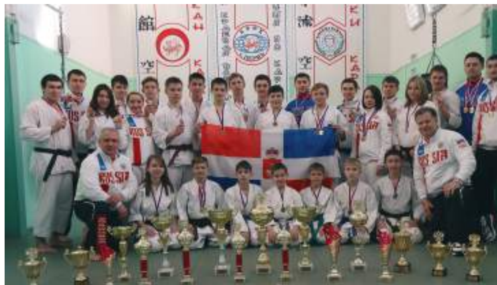
Победители и призеры Чемпионата и Первенства России, март 2016 г.

Г.К.: Говорить о школе по каратэ можно тогда, когда твои ученики становятся тренерами-преподавателями в родной alma-