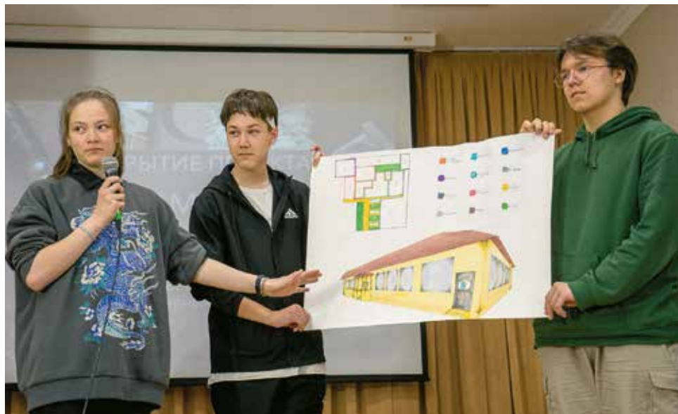
Команда МАОУ «СОШ «Петролеум»