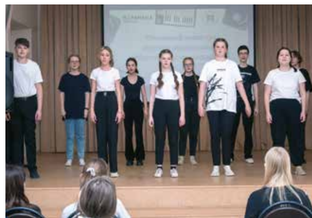
Хор № 3