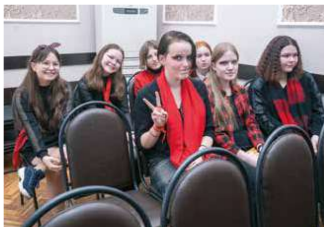
Хор № 2