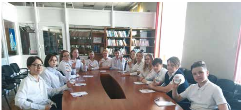
Отряд проекта #ЖИВОЕДЕТСКОЕ, МАОУ «Гимназия № 10»

«Благодаря плодотворной командной работе нам удалось вывести проект на такой высокий уровень и увидеть конкретные результаты. Учащиеся и педагоги всех трёх школ объединились в отряды, работали с документами и занимались совместными поисками героев. Это настоящий совместный труд и большой опыт для наших ребят».