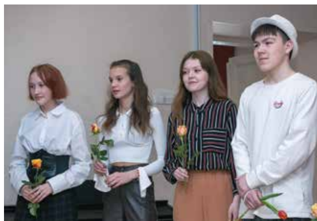
Хор № 1