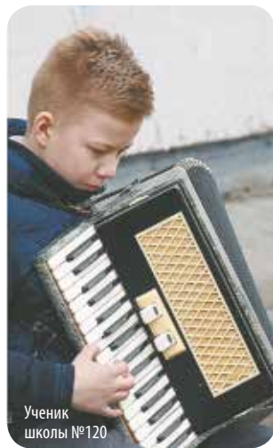
Ученик школы №120