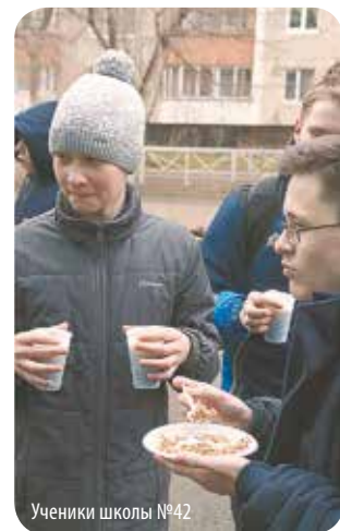
Ученики школы №42

Завершилось путешествие в школе №42, где организаторами и ведущими торжественной линейки выступили ученики 11 «Б» класса. К этому времени погода окончательно испортилась, но ребята держались. На таких мероприятиях, кажется, непозволительно показывать свои слабости, нужно быть сильным, стойким, как наши деды и прадеды. А к концу линейки, когда из машины вышли ребята в военной форме и пригласили всех на кашу, многие шли неторопливо, задумавшись. Но, как и в годы войны, горячая каша смогла поднять настроение, согреть, разговорить и развеселить: