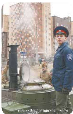
Ученик Кондратовской школы

Подкрепившись после испытаний, ребята из Кондратовской школы проводили кашу в путь-дорогу!