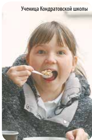
Ученица Кондратовской школы