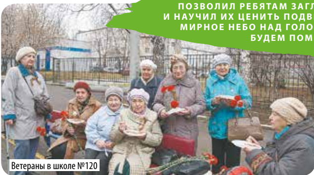
Ветераны в школе №120

РЕДАКЦИЯ И КОЛЛЕКТИВ ППТК НАДЕЮТСЯ, ЧТО ПРОЕКТ «ФРОНТАЛЬНАЯ КАША» ПОЗВОЛИЛ РЕБЯТАМ ЗАГЛЯНУТЬ В ПРОШЛОЕ И НАУЧИЛ ИХ ЦЕНИТЬ ПОДВИГ НАШИХ ПРАДЕДОВ. МИРНОЕ НЕБО НАД ГОЛОВОЙ – ИХ ЗАСЛУГА. БУДЕМ ПОМНИТЬ!