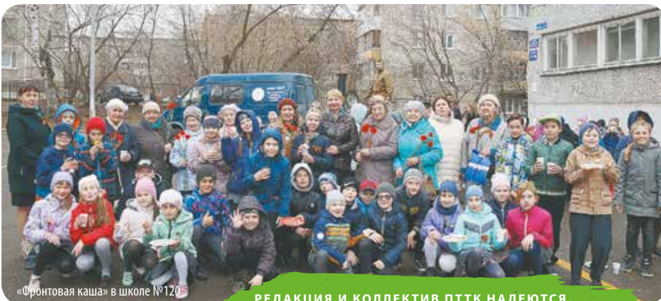
«Фронтальная каша» в школе №120

РЕДАКЦИЯ И КОЛЛЕКТИВ ППТК НАДЕЮТСЯ, ЧТО ПРОЕКТ «ФРОНТАЛЬНАЯ КАША» ПОЗВОЛИЛ РЕБЯТАМ ЗАГЛЯНУТЬ В ПРОШЛОЕ И НАУЧИЛ ИХ ЦЕНИТЬ ПОДВИГ НАШИХ ПРАДЕДОВ. МИРНОЕ НЕБО НАД ГОЛОВОЙ – ИХ ЗАСЛУГА. БУДЕМ ПОМНИТЬ!