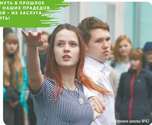
Ученики школы №42