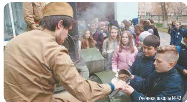
Ученики школы №42