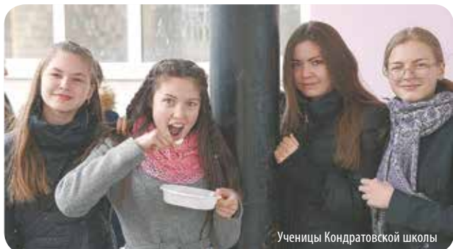
Ученицы Кондратовской школы

Самой первой «каша» посетила Кондратовскую школу. Когда ребята увидели машину с прицепом, они начали перешёптываться. Здесь «Фронтальную кашу» ждала масштабная праздничная программа, посвящённая Великой Победе. Её подготовили восьмиклассники. Историческая викторина, творческие задания,